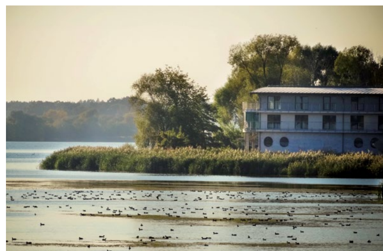
Krajobraz rzeki Skrwy łączącej się z Wisłą

Pierwsze wzmianki źródłowe o Brudzeniu pochodzą z XIV wieku. Z Mazowiecką Szwajcarią związanych jest kilka wybitnych postaci. W XIV wieku w Brudzeniu urodził się Paweł Włodkowiec (ok. 1373-1435), humanista, prawnik, pisarz polityczny, mąż stanu, rektor Akademii Krakowskiej, jeden z delegatów na sobór w Konstancji, gdzie bronił polskiej racji stanu w sporze polsko-krzyżackim. Z Murzynowa pochodził autor pierwszego przekładu Biblii na język polski Stanisław Murzynowski. Siecień to rodowe siedlisko wybitnego polskiego poety oświeceniowego bp. Ignacego Krasickiego. Informuje o tym jego epitafium w katedrze gnieźnieńskiej. W Sikorzku, w klasycystycznym dworcu należącym do rodziny Piwnickich, w okresie dwudziestolecia międzywojennego często gościli wybitni artyści, między innymi: Tadeusz Dołęga-Mostowicz, Antoni Stonimski, Julian Tuwim (napisał tu „Bal w operze”). Mazowiecka Szwajcaria wzbudzała w nich zachwyt. To tu nakręcono przedwojenny film „Profesor Wilczur”, a Julian Tuwim w „Kwiatach polskich” wspominał urok Sikorza. Parafia Sobowo na terenie gminy Brudzeń to rodzinne strony Lecha Wałęsy. Na przykościelnym cmentarzu pochowani są rodzice i rodzeństwo noblisty.