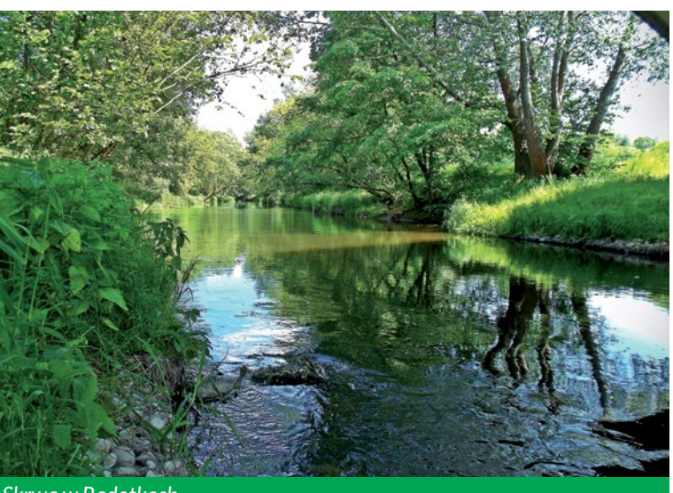
Skrwa w Radotkach

Mazowiecka Szwajcaria to turystyczna kraina, gdzie możesz pływać na jachcie i skuterze wodnym, uprawiać paralotniarstwo, wędkować, zbierać grzyby, jeździć konno i na rowerze, odbywać piesze wędrowki w Brudzeńskim Parku Krajobrazowym. Wyjątkową atrakcją są spływy kajakowe po rzece Skrwy. Warto do Brudzenia Dużego przyjechać w lipcu, na Festiwal Ginących Zawodów, gdzie można się bawić na licznych warsztatach starego rzemiosła.