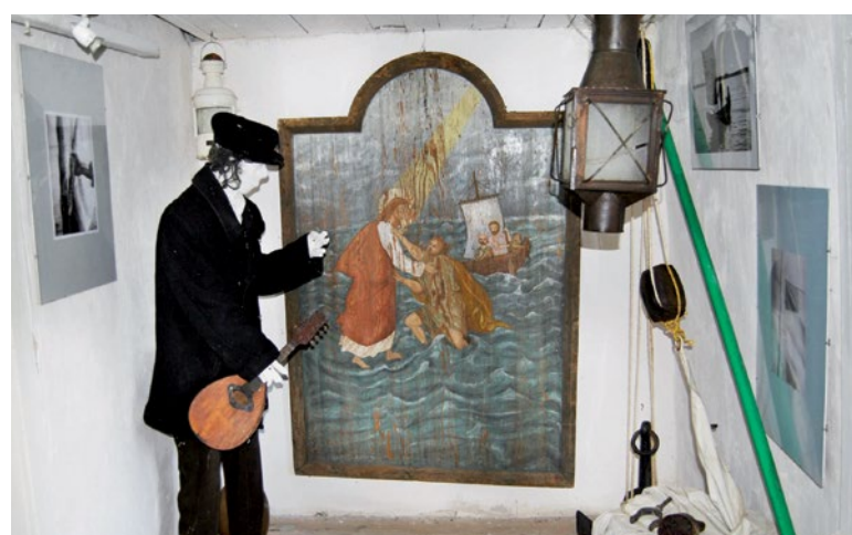
Muzeum w Murzynowie