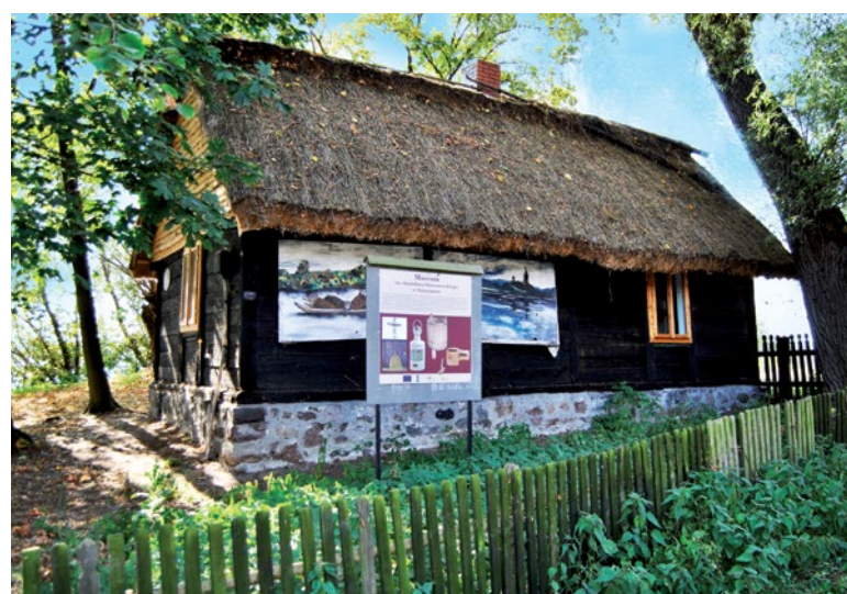
Muzeum w Murzynowie

Jako ciekawostkę warto wspomnieć, że w roku 1969 na zamowanym w Murzynowie statku „Neptun” kręcony był kultowy film „Rejs” Marka Piwowskiego.