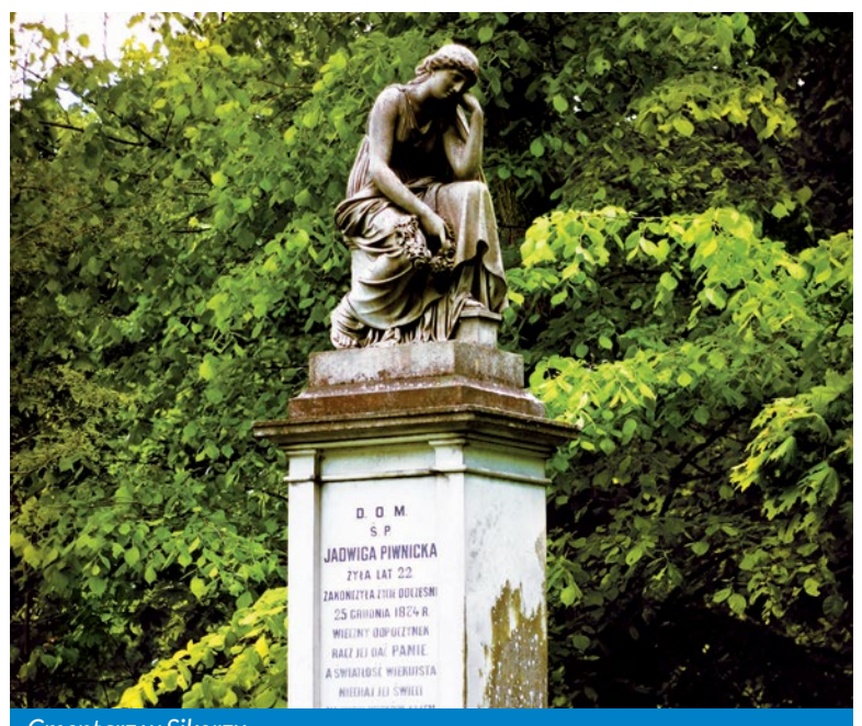
Cmentarz w Sikorzku

Przebiega przez gminę Brudzeń Duży na długości 32 km i jest jedynym znakowanym przez PTTK szlakiem. Podążając w kierunku południowo-wschodnim i oddalając się nieco od rzeki Skrwy, dojdziemy do wsi Radotki. Następnie wieś Siecień, w której podziwiać możemy zabytkowy kościół parafialny, późnorenansowy, z XVII w., z cennym obrazem Matki Boskiej Siecieńskiej z XV wieku. Podążając szosą w kierunku południowym, wędrujemy w otulinie BPK i zbliżamy się do Sikorza. Tutaj znajduje się kościół z lat dwudziestych XX wieku, z piękną polichromią wnętrza i ołtarzem głównym z białego marmuru oraz dworek klasycystyczny z XIX wieku wraz z parkiem. Sikórz uznawany jest za stolicę Mazowieckiej Szwajcarii ze względu na piękną dolinę Skrwy Prawej. Wędrujemy do północnej części rezerwatu „Sikórz” w kierunku Brudzenia Dużego. Ścieżką dochodzimy do wczesnośredniowiecznego grodziska, datowanego na VIII-XI wiek. Następnie mijamy pomnik przyrody (dwa okazałe buki) i dochodzimy do Brudzenia Dużego. Można tu zwiedzić dwór klasycystyczny z przełomu XIX i XX wieku z zabytkowym parkiem. Kolejna na trasie jest wieś Bądkowo Kościelne, a w nim późnobarokowy kościół parafialny z XVIII wieku, z ozdobnym portalem z trzema herbami. Następnie drogą dochodzimy ponownie do doliny Skrwy i szlakiem w terenie otwartym podążamy do przysiółka Bądkowo-Rochny. Wędrując wśród pól uprawnych, opuszczamy gminę Brudzeń Duży.