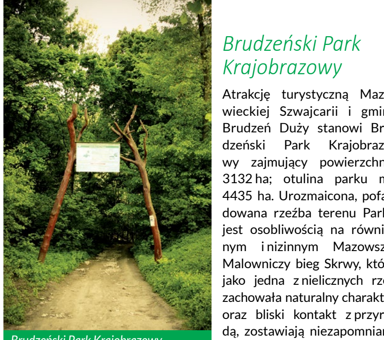
Brudzeński Park Krajobrazowy

Park obejmuje dolinę Skrwy Prawej oraz przylegające kompleksy leśne w uroczyskach Brwilno, Sikórz i Brudzeń, a także fragment połodowcowy Rynny Karwosiecko-Cholewickiej wraz z ciągiem drobnych jezior i torfowisk. Różnorodność siedlisk cechująca Brudzeński Park Krajobrazowy stwarza doskonałe warunki dla występowania bogatej fauny, w tym wielu ginących gatunków, szczególnie ptaków – około 120 gatunków lęgowych oraz 30 gatunków przelotnych i zimujących. Do lęgowych gatunków zarejestrowanych umieszczonych w „Polskiej Czerwonej Księdze Zwierząt” należą bąk i błotniak zbożowy. W grupie ptaków zagrożonych w skali europejskiej zaobserwowano w Parku 15 gatunków, najważniejsze z nich to: bązek, bocian czarny, trzmielojad, zimorodek, jarzębka i ortolan. Stwierdzono też występowanie derkacza – to jedyny gatunek na opisywanym terenie zagrożony w skali światowej.