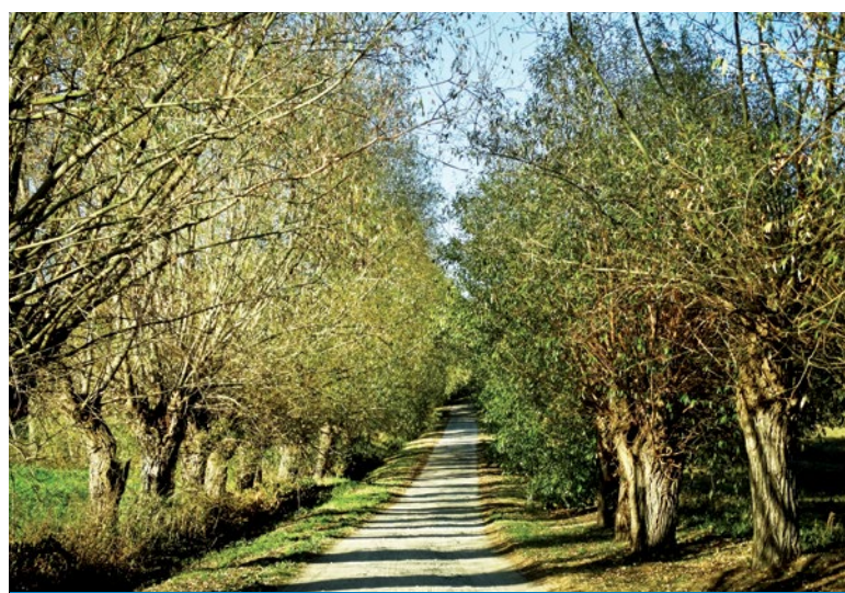
W drodze do Murzynowa