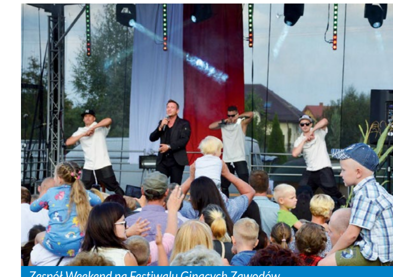
Zespół Weekend na Festiwalu Ginących Zawodów