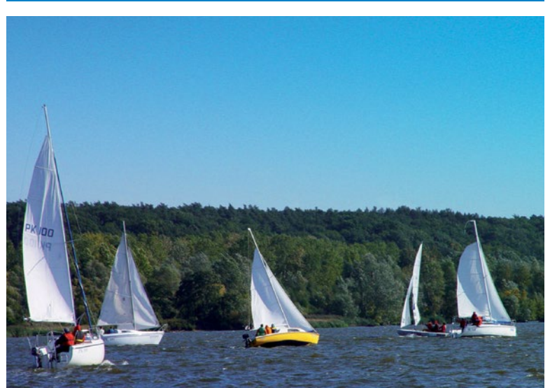
Żaglówki na Wiśle