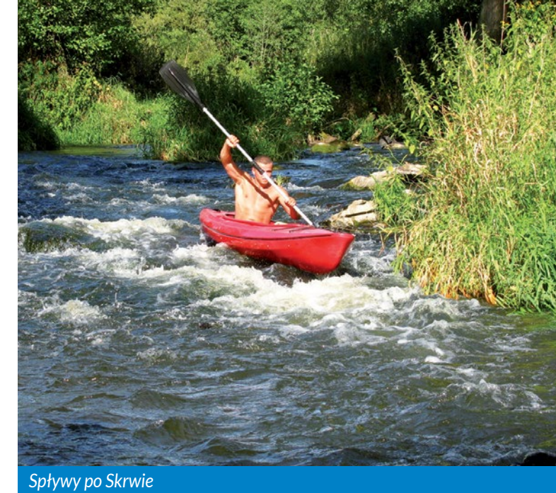
Spływy po Skrwy

Atrakcję turystyczną Mazowieckiej Szwajcarii i gminy Brudzeń Duży stanowi Brudzeński Park Krajobrazowy zajmujący powierzchnię 3132 ha; otulina parku ma 4435 ha. Urozmaicona, pofalowana rzeźba terenu Parku jest osobliwością na równinym inżynym Mazowsza. Malowniczy bieg Skrwy, która jako jedna z nielicznych rzek zachowała naturalny charakter oraz bliski kontakt z przyrodą, zostawiają niezapomniane wrażenie na turystach.