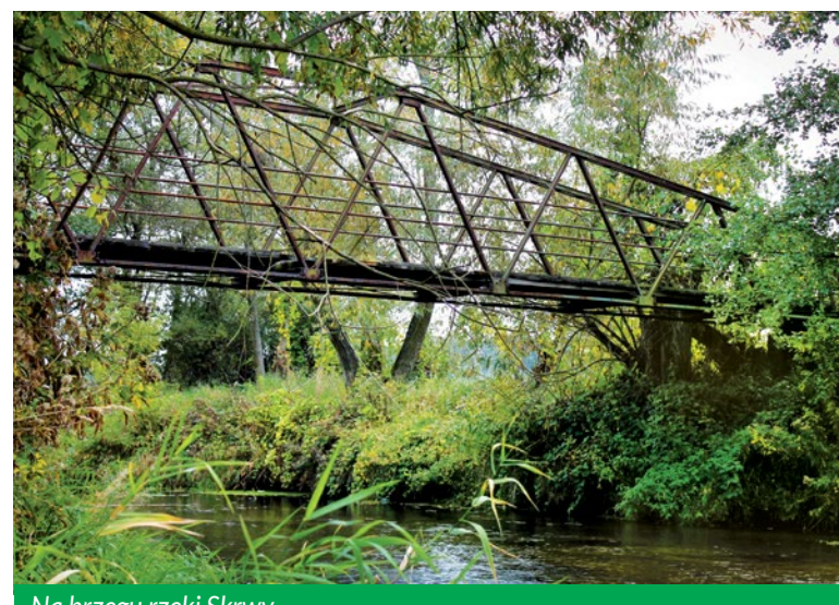
Na brzegu rzeki Skrwy