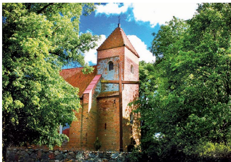
Kościół w Rokiciu

Późnoromańska świątynia z XIII wieku, zwana przez miejscowych „kobyliłm kościołem”, to najcenniejszy zabytek w gminie Brudzeń. Legenda mówi, że został zbudowany z datków pochodzących ze sprzedaży dzikich koni wyłapywanych po okolicznych wzgórzach; na murach kościoła wyryte są znaki epitafijne (jodełki, plugi, brony), nazwiska i daty majstrów remontujących kościoły w dawnych wiekach. Ciekawostką jest też fakt istnienia kilkuset wgłębień w ceglach, będących pozostałościami po rozpalaniu przy użyciu drewna ognia w Wielką Sobotę w dawnych wiekach.