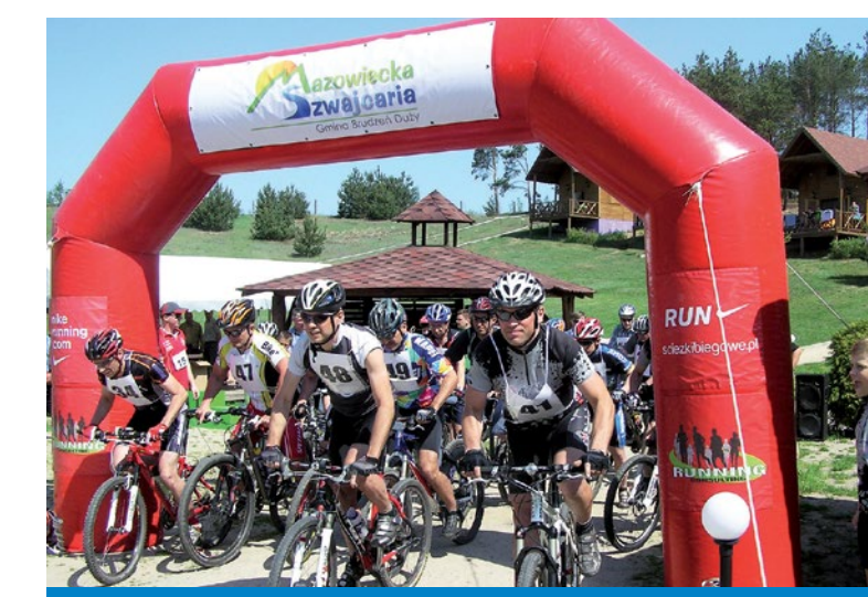
Duathlon po Mazowieckiej Szwajcarii

Park obejmuje dolinę Skrwy Prawej oraz przylegające kompleksy leśne w uroczyskach Brwilno, Sikórz i Brudzeń, a także fragment połodowcowy Rynny Karwosiecko-Cholewickiej wraz z ciągiem drobnych jezior i torfowisk. Różnorodność siedlisk cechująca Brudzeński Park Krajobrazowy stwarza doskonałe warunki dla występowania bogatej fauny, w tym wielu ginących gatunków, szczególnie ptaków – około 120 gatunków lęgowych oraz 30 gatunków przelotnych i zimujących. Do lęgowych gatunków zarejestrowanych umieszczonych w „Polskiej Czerwonej Księdze Zwierząt” należą bąk i błotniak zbożowy. W grupie ptaków zagrożonych w skali europejskiej zaobserwowano w Parku 15 gatunków, najważniejsze z nich to: bązek, bocian czarny, trzmielojad, zimorodek, jarzębka i ortolan. Stwierdzono też występowanie derkacza – to jedyny gatunek na opisywanym terenie zagrożony w skali światowej.