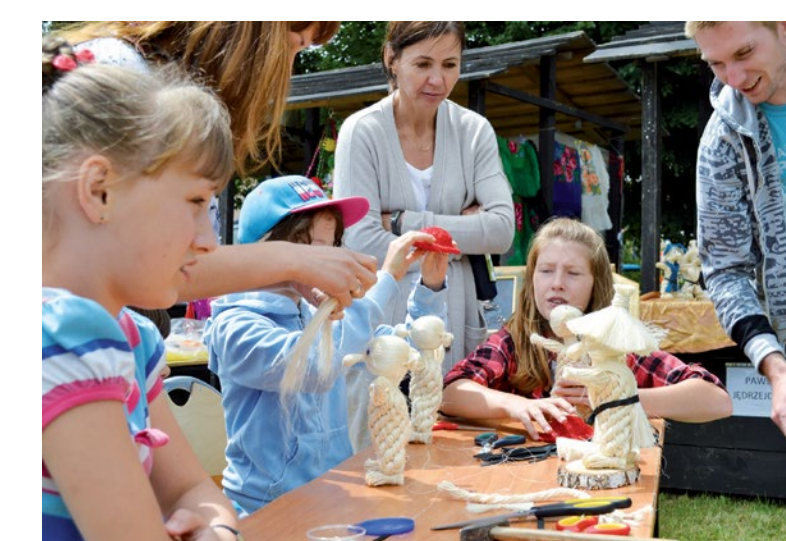
Festiwal Ginących Zawodów