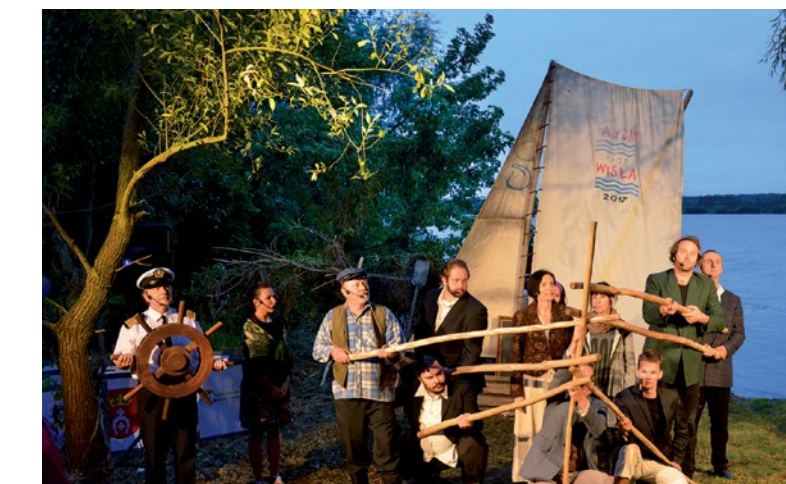
Plocki Teatr Dramatyczny w Murzynowie