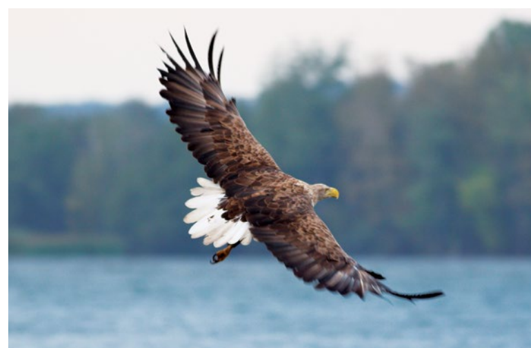
Na brzegu rzeki Skrwy